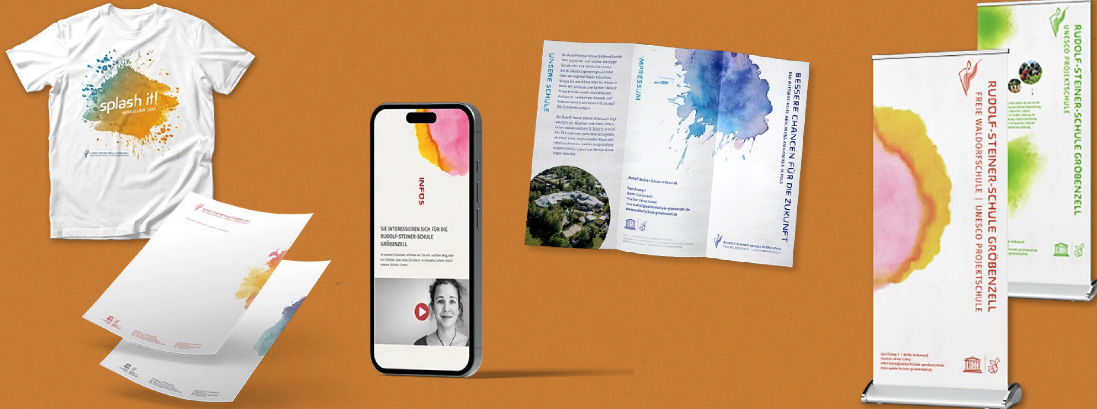
Auswahl des Medienportfolios der Rudolf-Steiner-Schule Gröbenzell